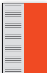
1/2 lpp. vert. 97 x 295 mm EUR 690,-