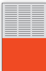
1/2 lpp. hor. 200 x 145 mm EUR 690,-