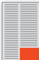
1/6 lpp. jaunums 95 x 95 mm EUR 250,-