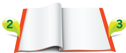
2. vāks 200 x 295 mm EUR 1210,-