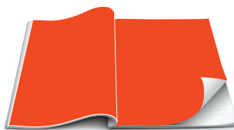
4. vāks 200 x 295 mm EUR 1240,-