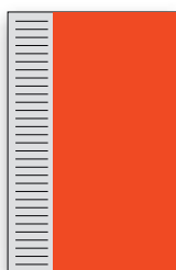
2/3 lpp. 124 x 295 mm EUR 870,-