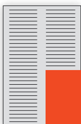
1/4 lpp. 97 x 145 mm EUR 410,-